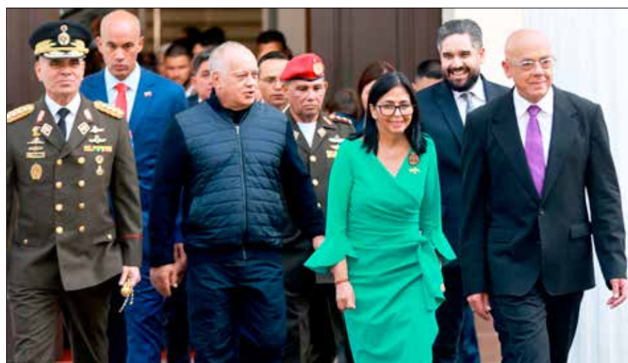
▲ La presidenta en funciones es acompañada por los ministros de Defensa, Vladimir Padrino, y del Interior, Diosdado Cabello (izquierda), así como

el presidente de la Asamblea Nacional, Jorge Rodríguez (derecha). / P 3