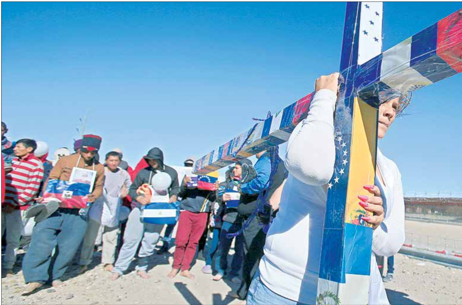
▲ Migrantes y colectivos de Ciudad Juárez, Chihuahua, realizaron el llamado Viacrucis ponte en mis zapatos , una marcha con los pies descalzos cerca del río Bravo, donde se alza el muro fronterizo. El