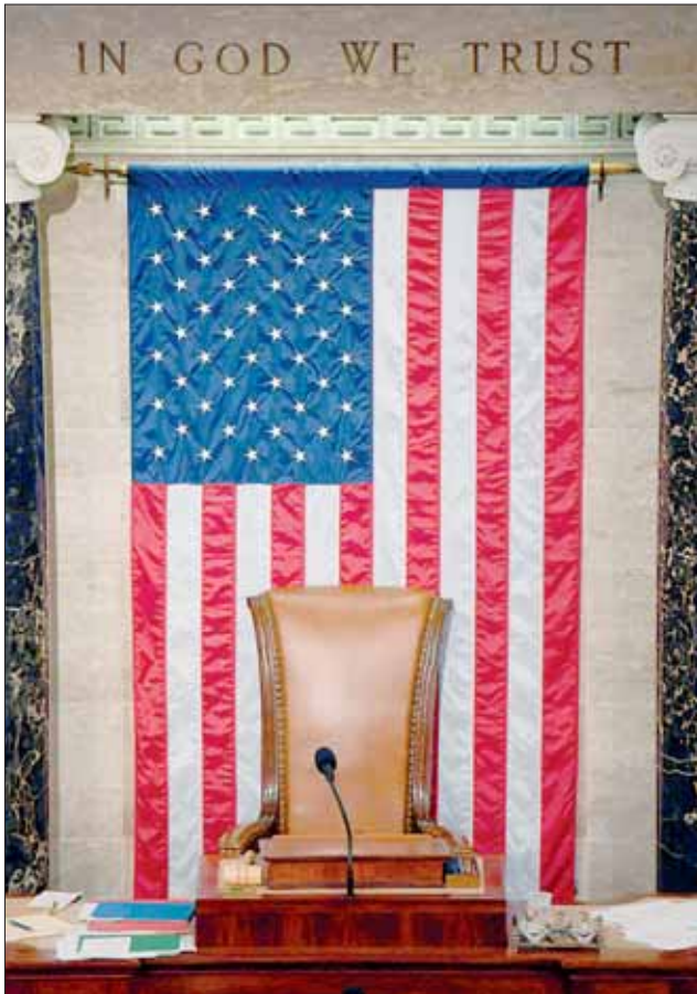
▲ La silla del sucesor de Nancy Pelosi sigue desocupada.

JUEVES 5 DE ENERO DE 2023 // CIUDAD DE MÉXICO // AÑO 39 // NÚMERO 13815 // Precio 10 pesos